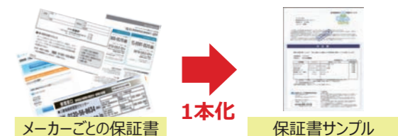
メーカーごとの保証書

メーカーごとの保証書・連絡先を探すお手間をなくし、スムーズな対応をご提供します。